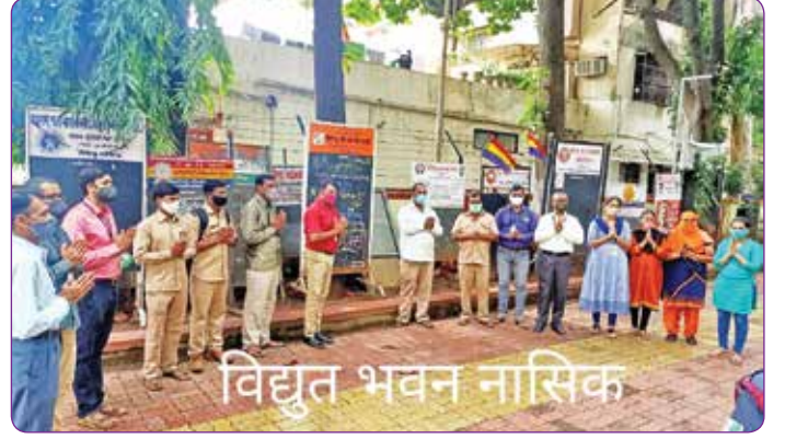
विद्युत भवन नासिक