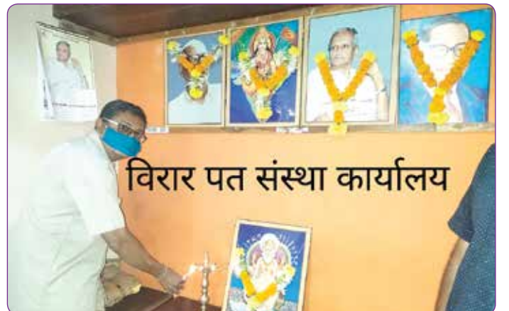
विरार पत संस्था कार्यालय